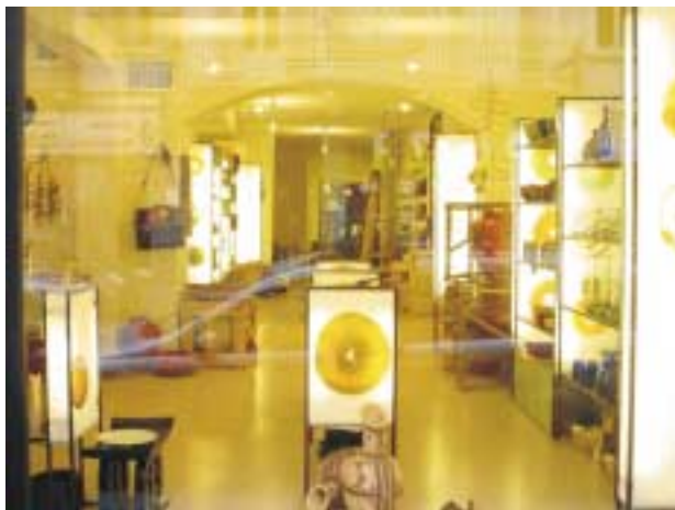
Toller Weltladen in Italien

Anlässlich dieses Treffens veranstaltet von NEWS! (network of european worldshops - europäische Dachverband, 15 Mitgliedsländer (etwa 2700 Weltläden) vernetzt und organisiert sind, gibt 'einen Schaufensterwettbewerb.