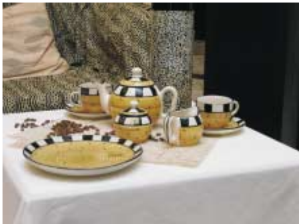
Ausstellung in Baden

Die Kundenbegeisterung ist die Voraussetzung für den Unternehmenserfolg. Der Kunde muss für sich einen Nutzen erkennen. Damit dieser Nutzen entsprechend erkennbar und begreifbar ist, ist die Wareninszenierung bzw. -dekoration ein wesentlicher Erfolgsfaktor. Die Ware muss dem Kunden eine Aussage bieten.