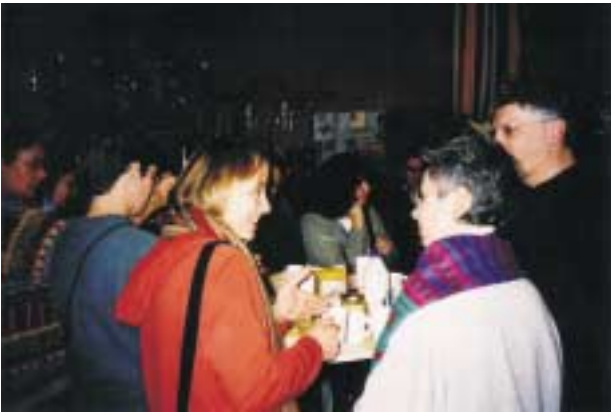
Interessante Gespräche beim Fairen Frühstück in Mödling

Samstag, 15. November, war der 3. Samstag im Monat, also wieder Faires Frühstück im Weltladen Mödling. Diesmal ging es - zur großen Freude der Kinder - um Spielsachen, Spiele und Kinderbücher. Zahlreiche Besucher und Besucherinnen und sogar die Kleinen lauschten dem interessanten Vortrag über die Geschichte der Spielzeuge. Das interessierte Publikum erfuhr auch von Handwerkskooperativen in den Ländern des Südens, die das Handwerk dahingehend unterstützen, dass alte Formen bewahrt, aber auch neue entwickelt werden und dass die HandwerkerInnen ihre Produkte ohne gewinnorientierten Zwischenhandel absetzen können. Anschließend gab es einen Videofilm über „Gospelhouse“, einer Handwerkskooperative in Sri Lanka. Während dann die Erwachsenen bei Kaffee und Tee gesunde und trotzdem gute Brote mit „fairen“ Aufstrichen genossen, konnten sich die Kinder in aller Ruhe jene Spielsachen aussuchen, die sie zu Weihnachten geschenkt haben wollen. Die fairen Frühstücke im Weltladen Mödling haben sich zum beliebten Treffpunkt von solidarisch gleich gesinnten und weltoffenen Menschen entwickelt. Das nächste faire Frühstück findet am Samstag, den 20. Dezember, statt.