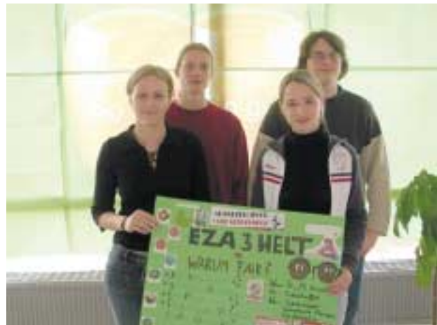
Schülerinnen der HAK/HASCH Retz