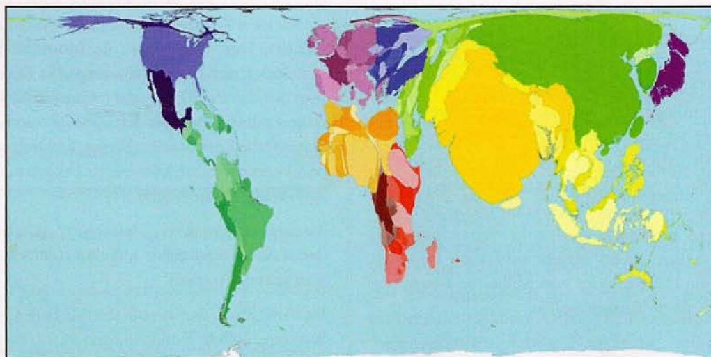
Isodemographische Karte (Die Fläche jedes Gebietes zeigt seinen relativen Anteil an der Weltbevölkerung). Nähere Erläuterungen und Quelle: www.sasi.group.shef.ac.uk/worldmapper/display.php?selected=2

Als zweite Aufgabe gilt es, die (ungefähre) Wirtschaftskraft (das Bruttoinlandsprodukt) der einzelnen Regionen herauszufinden. Das BIP stellt alle Wirtschaftsleistungen und Güter da, die Staaten in einem Jahr produzieren. Das BIP zeigt nicht das angehäuften Vermögen, hat aber über die historisch errungene Stellung im Weltwirtschaftssystem viel damit zu tun. Machen Sie vorher klar,