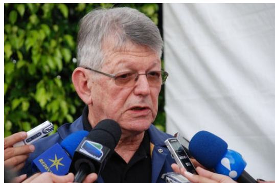
Bischof Erwin Kräutler stellt sich seit Jahrzehnten vehement auf die Seite der Betroffenen des Staudammbaus .

Der aus Österreich stammende Dom Erwin Kräutler , Bischof der Prälatur Xingu und Präsident des Indianermissionsrats der brasilianischen Bischofskonferenz CIMI (Conselho Indigenista Missionário),