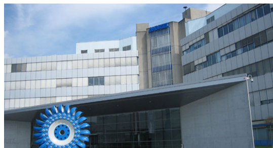
Der österreichische Turbinenhertsteller Andritz AG könnte zu einem der Nutznießer von ‚Belo Monte‘ werden.