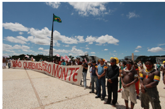
Proteste gegen die Errichtung von „Belo Monte“ im Regierungsviertel von Brasília.0