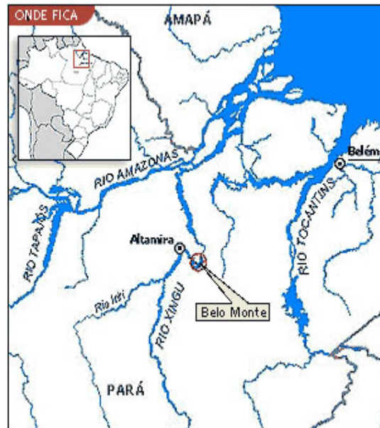
Lage des geplanten Kraftwerks ‚Belo Monte‘ an der „Großen Schlinge“ (Volta Grande) des Xingu-Fluss.

Das Projekt wurde bereits früher aufgrund des Widerstands der am Xingu lebenden indigenen Bevölkerung gestoppt. Unter dem Namen „Belo Monte“ wurde es von Präsident Luíz Inácio Lula da Silva zu einem Schlüsselprojekt des ambitionierten „Programms zur Beschleunigung des Wachstums“ (Programa de Aceleração do Crescimento, PAC) gemacht. Seither wird es ohne Berücksichtigung der Einwände der betroffenen Bevölkerung und der Wissenschaft durch gepeitscht. Die neue brasilianische Präsidentin Dilma Rousseff hat gleich zu Beginn ihrer Amtszeit den Druck weiter erhöht und setzt sich über die geltenden Umweltgesetze hinweg.