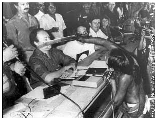
Als Symbol des indigenen Widerstands ging das Bild der Indigenen Tuira, die bei der Versammlung 1989 in Altamira mit einer Machete das Gesicht des derzeitigen Direktors von Eletronorte, José Antonio Muniz Lopes, berührte, um die Welt