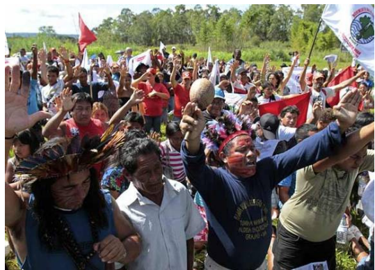
Proteste nach der turbulenten Versteigerung der Lizenz zur Errichtung von ‚Belo Monte‘.