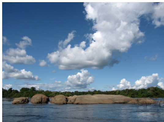
Die einzigartige Artenvielfalt des Xingu droht unwiederbringlich verloren zu gehen